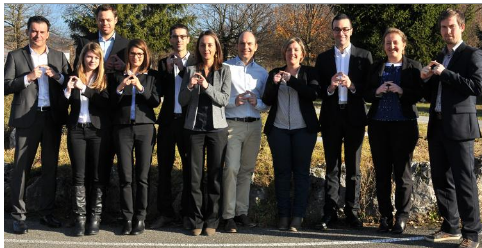
L'équipe de Batisafe prête à emménager dans ses nouveaux locaux le 15 avril prochain.

Le bureau d'études, de maîtrise d'œuvre et de formation pour la mise aux normes et l'aménagement des bâtiments prépare son déménagement dans de nouveaux locaux, dans la zone de Savoie Hexapôle à Méry.